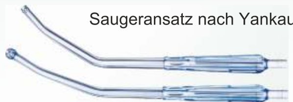
Saugeransatz nach Yankauer