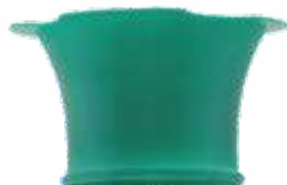
Ø 40 mm DC81050-01