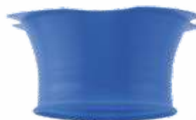
Ø 40 mm DC81050-02