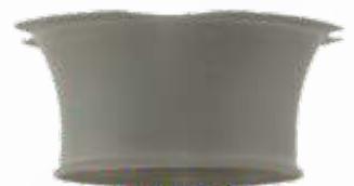
Ø 48 mm DC81050-03