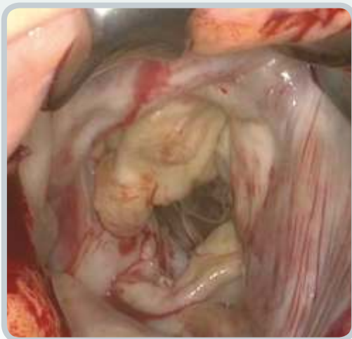
Subvalvuläre Anatomie der Mitralklappe schlecht zu sehen?