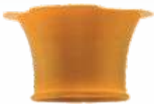
Ø 36 mm DC81050-00